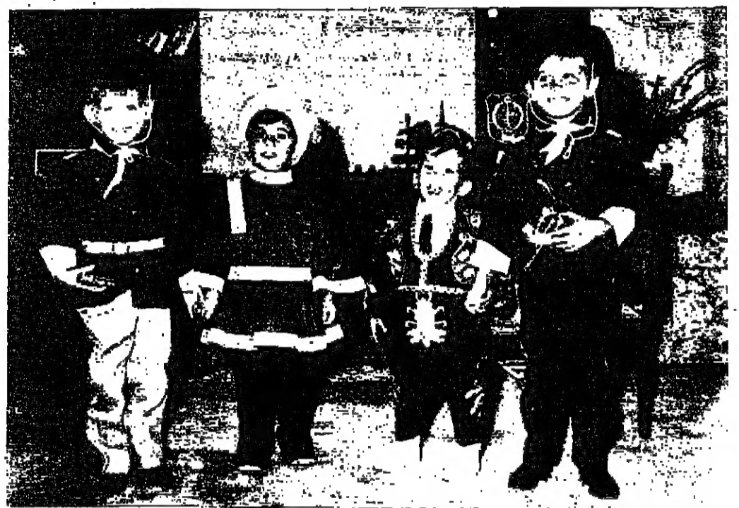
استقبل سمو الامير طلال بن محمد امس ، المام الرابع من عمره السيد ، وقد اقبل السيد يعقوب تورانيان « سيرايس » هذه الصورة خلال الحفلة التي اقيمت امس بالخاصة السنية ، ويرى سموه « الثاني من اليسار » بين سمو الامير عبد الكوسوسو الامير فيصل نجلي جلالة الملك المعظم وسمو الامير غازي شقيق الامير طلال

الجزائر تفتح عن لاسا واطفال اسرئليين خلال ايام وتحفظ بالملاحين باريس - ذكرت وكالة الفونتينبيرس ان الجنرال ديغول رئيس الجمهورية الفرنسية سيوجه خلال اليومين القادمين نداء الى الرئيس الجزائري هواري بومدين للاخراج من الطائرة الاسرائيلية وملاحين وركابها الاسرائيليين وقالت الوكالة ان المصادر الاسرائيلية في تل ابيب تبدي شكها في ان يورط الرئيس ديغول نفسه في مثل هذا الموضوع فرنسا لا تتلقى ورقت مصادر قصر العليزيه في باريس التعليق على هذا النداء الذي نشرته الصحف الاسرائيلية غير انها قالت ان الرئيس ديغول لا يمكن ان يورط نفسه على النحو الذي نشرته صحف اسرائيل وافرح مصادر جزائرية بان اربع نساء وثلاثة اطفال من مجموع ١٤ راكم اسرائيليا احتجزوا هنا طيلة اربعين طاقرةم الاسرائيلية على الهبوط في مدينة الجزائر يوم الثلاثاء الماضي سيرج عنهم في نهاية التسوع وقالت هذه المصادر ان الركاب الاسرئليين واما الى روما - غير ان سفينة الطائرة الثلاث وسبعة ملاحين واخرين وخمسة ركاب من الككور وكان قد سرح ثلاثة وعشرين راكما من غير الاسرائيليين بمغادرة الجزائر